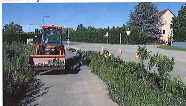
Juliette ZIEGLER (désherbage piste cyclable)