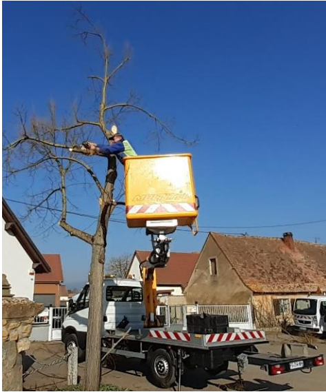
Elagage du Tilleul place de l'église