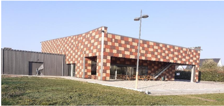
Fin des travaux du local de stockage à l'Espace Horizons