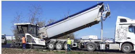
Rénovation du chemin de la ferme