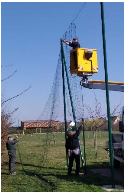
Pose filet au city park