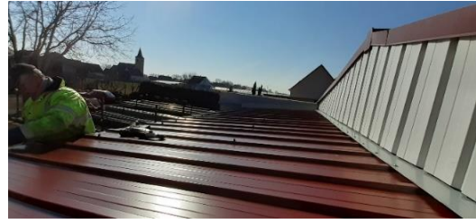
Rénovation Local des Ateliers Municipaux (toiture et sol)